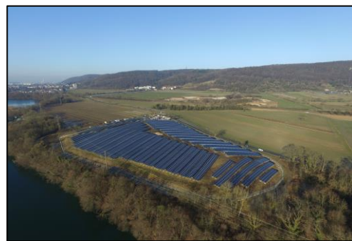
Solarpark am Rhein